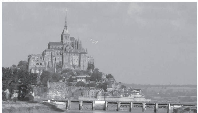
Mont Saint Michel, Foto Dr. Wulff-Woesten

Die Besichtigung des Gezeitenkraftwerkes an der Mündung des Flusses Rance bei Saint-Malo an der Nordküste der Bretagne verdeutlichte, wie schon vor Jahr-