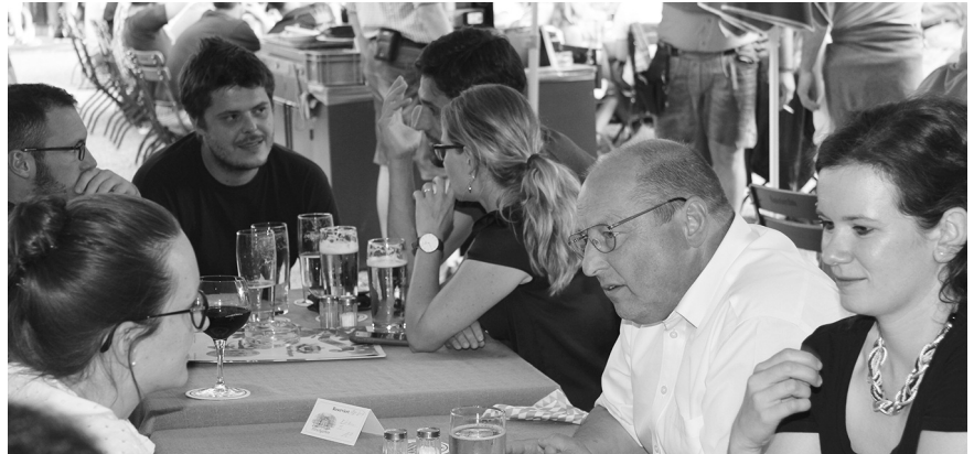
Ungezwungener Austausch zwischen Vorstand und jungen Ingenieuren im Biergarten.

Einig war man sich schnell darin, dass ein Arbeitskreis, der sich speziell an Studierende und Berufsanfänger richtet, gewinnbringend sei. Schließlich brennen den jungen Ingenieuren ande-