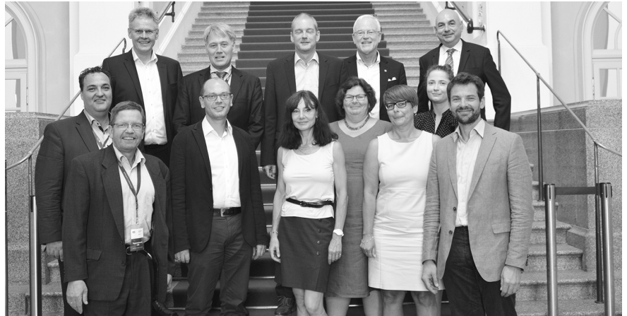
Die Kammervorteiler im Gespräch mit Landtagsabgeordneten der Grünen.

Abschließend ging er auf die neue Verwaltungsvorschrift Technische Baubestimmungen ein, die mit ca. 350 Sei-