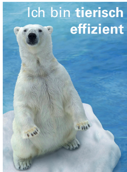
Energieeffizienz von den Tieren abschauen