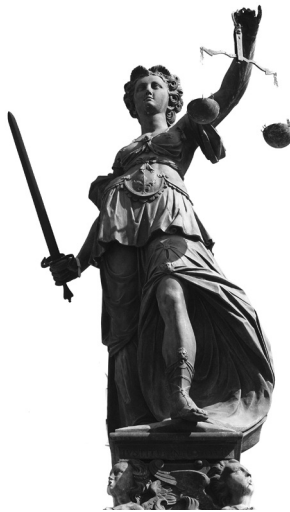
Was denkt Justitia über Robin Hood?

Wie fließend diese Übergänge zuweilen gestaltet werden, zeigt der von