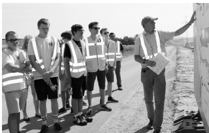
Schüler schnuppern Bauluft.

Die Vereinigung der Straßenbau- und Verkehrsingenieure in Bayern e.V. und die Bayerische Ingenieurekammer-Bau luden Schüler des Markgraf-Georg-