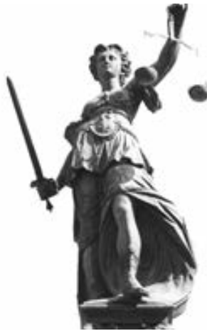
Besonderheiten der Architekten- und Ingenieurverträge

Für diese Fallgestaltung besteht dann ein Sonderkündigungsrecht für beide Vertragsparteien. Die Besonderheiten dieser Alternative und das darauf beruhende Sonderkündigungsrecht werden auf Grund der Komplexität und der Relevanz für die Praxis in einem Artikel in der Folgeausgabe von „Ingenieure in Bayern“ ausführlich behandelt.