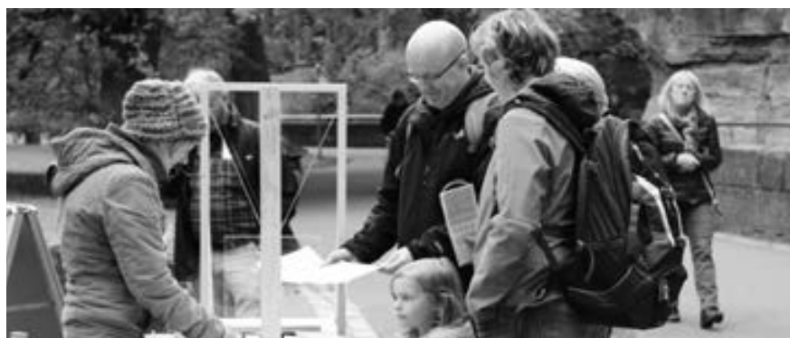
Bei diesem Energie-Experiment konnten die Besucher Vieles lernen.

Am Ende des Tages gaben über 200 fleißige Rätsler ihr ausgefülltes Bonus-