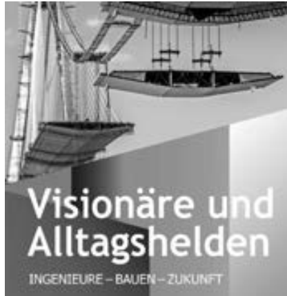
Ausstellung zum Bauingenieurwesen

Um all die faszinierenden, umfassenden und innovativen Facetten des Berufs des Bauingenieurs darzustellen, zeigt das Oskar-von-Miller-Forum vom 10. November 2017 bis zum 14. Januar