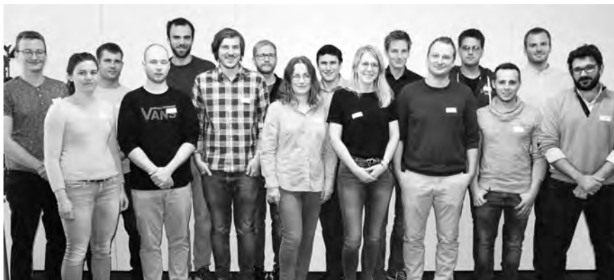
16 neue Trainees durfte die Kammer Mitte Oktober begrüßen.

Einblick erhalten die 16 Trainees aber in die unterschiedlichsten Teilgebiete des Bauingenieurwesens. „Ein Ziel des Programms ist es, die Perspektiven,