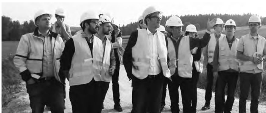
Interessiert folgten die ehemaligen Trainees den Ausführungen.

In drei Vorträgen erfuhren die jungen Ingenieure alles rund um den Autobahnausbau. Als im Anschluss ver-