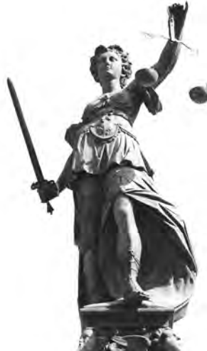
Auch bei der HOAI gilt die Unschuldsvermutung.

Das pikante war, dass es sich bei dem beklagten Auftraggeber um keinen anderen als die Bundesrepublik Deutschland gehandelt hat, die vor dem EuGH die Aufgabe hat, die HOAI zu verteidigen. In Luxemburg die Gültigkeit der HOAI zu vertreten, um in Sachsen-Anhalt genau das Gegenteil zu tun, hat dem OLG Naumburg nicht recht gefallen, welches selbst keinen Zweifel an der Vereinbarkeit der Honorarordnung mit EU-Recht aufkommen ließ. Geklagt hatte ein Ingenieurbüro aus einem Vertrag über die Grundinstandsetzung eines Altarm- und eines Durchstichwehrs und dabei eine nach den Mindestsätzen der HOAI berechnete Forderung geltend gemacht, die oberhalb der ver-