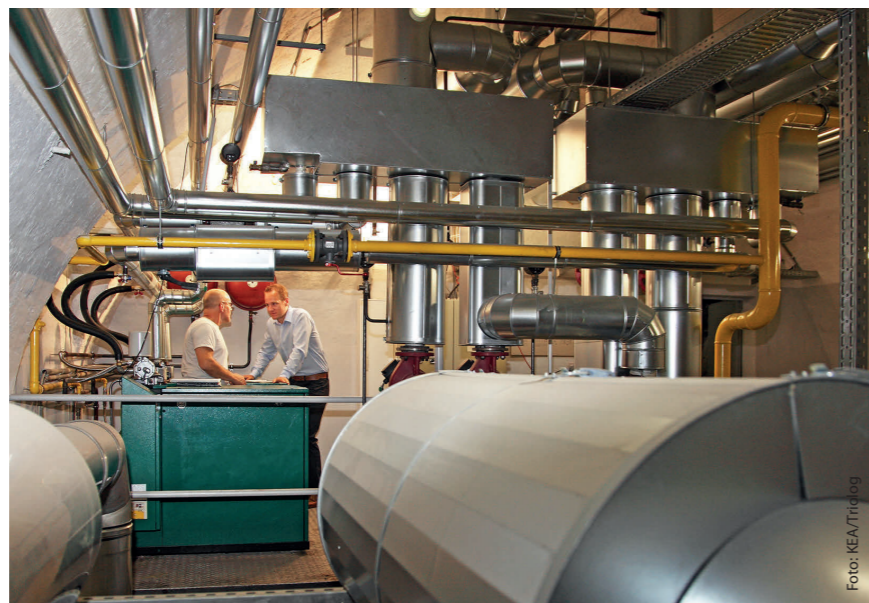
BHKW lohnen sich auch in Nichtwohngebäuden

Mit BHKW können Gebäudeeigentümer direkt vor Ort sowohl ihren Strom- als auch ihren Wärmebedarf decken – und das besonders effizient. Die Erzeugung von mechanischer Energie zur Umwandlung in elektrischen Strom