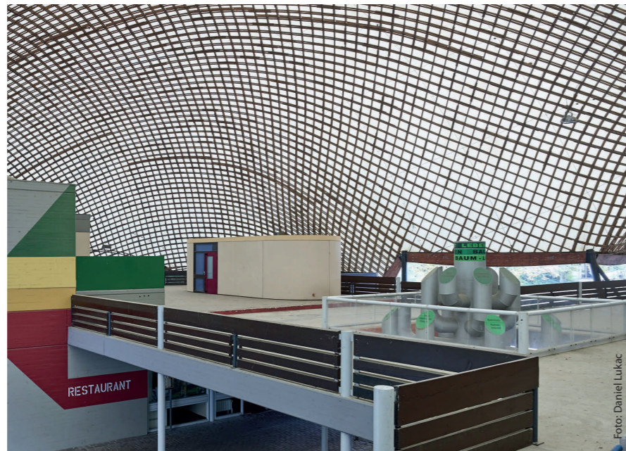
Die Multihalle Mannheim gilt als weltweit größte Holzgitterschalenskonstruktion

Nach einem Expertengespräch über den Fortbestand der Multihalle, hatte die Ingenieurkammer Baden-Württemberg eine Handlungsempfehlung zur Sanierung abgegeben. Im Expertengespräch herrschte Einigkeit darüber, dass die Multihalle ein außergewöhnliches, weltweit einzigartiges Tragwerk darstellt und es aller Anstrengungen bedürfe, dieses Denkmal zu erhalten und einer öffentlichen Nutzung zuzuführen. Präsident Stephan Engelsmann gab zu verstehen: „Eine Instandsetzung sollte den ursprünglichen Zustand möglichst erhalten. Insbesondere soll der Raumeindruck nicht durch zusätzliche Stützen oder Einbauten gestört werden. Außerdem muss die Konstruktion instandgesetzt werden, um die Standsicherheit wiederherzustellen.“ Weiterhin müssten die Knotenverbindungen der Gitter-