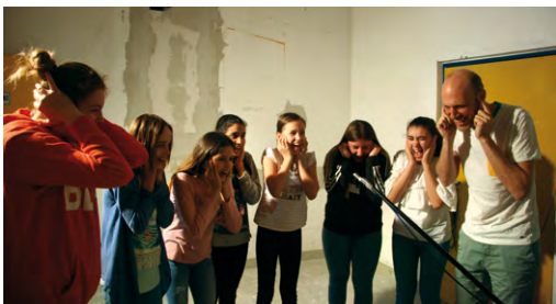
ITA Ingenieurgesellschaft: Test: Wer schreit am lautesten?

Auch beim Ingenieurbüro osd GmbH in Frankfurt waren die teilnehmenden Mädchen begeistert von dem ereignisreichen Tag. Neben Einblicken in die tägliche Büroarbeit erhielten sie einen Überblick über bereits realisierte Projekte im Raum Frankfurt und entwickelten nach Vorgaben ein Hochhausprojekt im Modell.