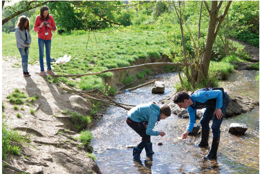
Wasseranalyse am Wellritzbach.

Mit dem ebenfalls traditionellen Büroprojekt öffneten wieder zahlreiche Mitgliederbüros der Ingenieurkammer Hessen ihr Ingenieurbüro und boten Mädchen Einblicke in ihren Berufsalltag. Beim Projekt „Tag des offenen Ingenieurbüros“ beteiligten sich unter anderem die ITA Ingenieurgesellschaft für Technische Akustik mbH in Wiesbaden,