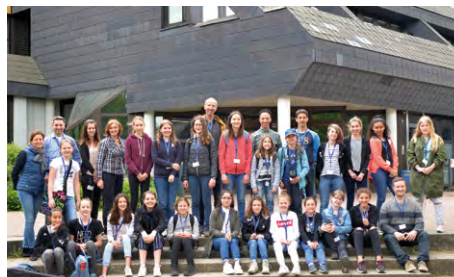
HS-RM: Teilnehmerinnen der Hochschulprojekte