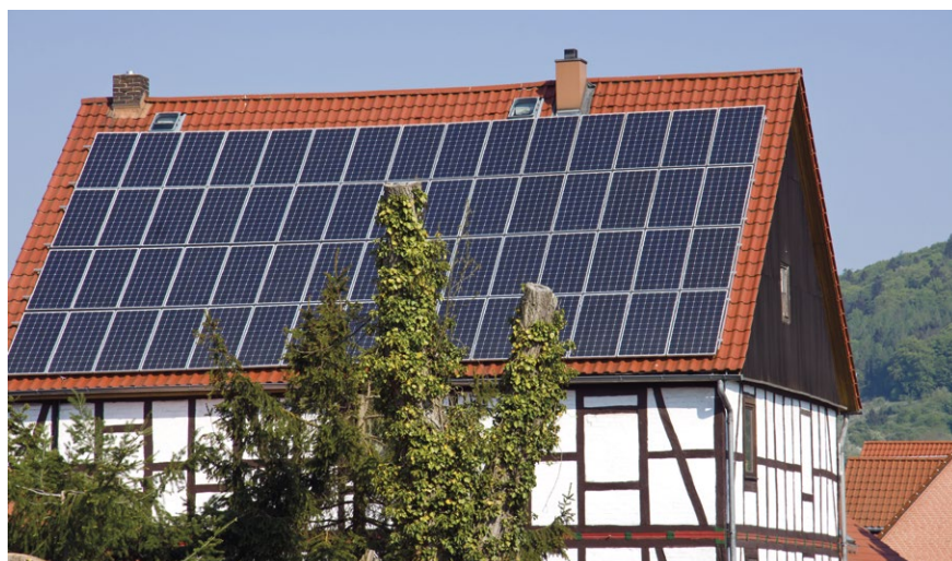
Mit dem neuen Klimaschutzgesetz des Landes wird die Installation von Photovoltaikanlagen auf denkmalgeschützten Gebäuden erleichtert.

Baden-Württemberg will bis 2040 klimaneutral werden. Um dies zu erreichen, hat die Koalition ein neues Klimaschutzgesetz auf den Weg gebracht. Im INGBWaktuell-Interview erklärt Umweltministerin Thekla Walker (Grüne), wie die ambitionierten Ziele im Baubereich erreicht werden sollen und welche Rolle die Ingenieure dabei spielen.