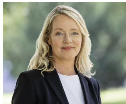
Thekla Walker ist Ministerin für Umwelt, Klima und Energiewirtschaft des Landes Baden-Württemberg

Ich sehe vielmehr eine große Chance darin für die Industrie, um damit Treibhausgas und Energiekosten gleichermaßen einzusparen. Kurzfristig müssen wir natürlich alles dafür tun, damit die Industrie nicht zusätzlich belastet wird, aber den Industriestandort und damit auch den Wohlstand der Menschen bei uns im Land können wir langfristig nur erhalten, wenn es uns