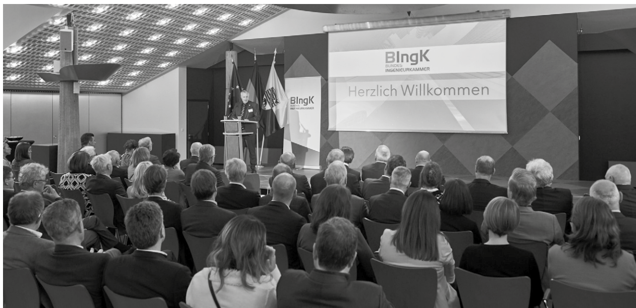
Die 71. Bundesingenieurkammer-Versammlung (BKV) fand am 26. April in Brüssel statt

Listenharmonisierung im Fokus der Diskussion