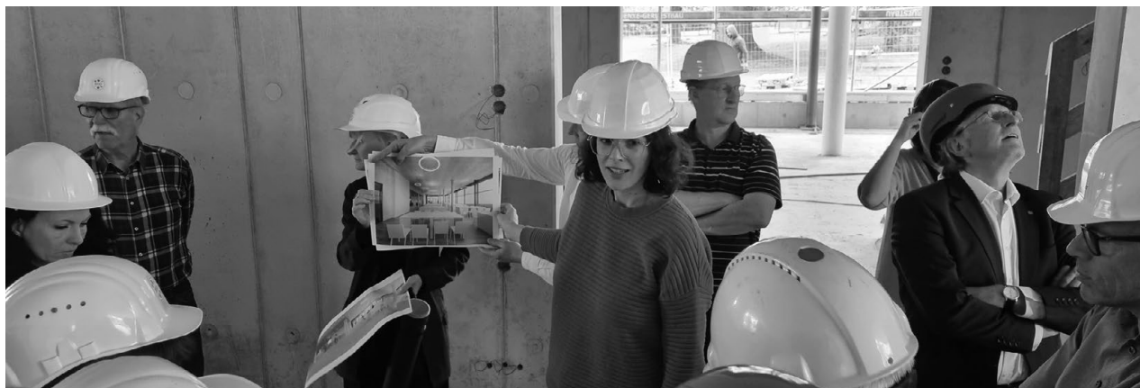
Baustellenbesichtigung des Forschungsinstitutes „Deutsches Elektronen-Synchrotron-Center“ (Desy) Zeuthen

Am 11. Mai 2023 trafen sich 22 Kammermitglieder der Region RBS Fürstenwalde zu einer hochinteressanten Fachexkursion im Forschungsinstitut „Deutsches Elektronen-Synchrotron-Center“ (Desy) Zeuthen. Dieses Institut befasst sich u. a. mit der astronomischen Datenerfassung eines weltweiten Netzwerkes von Observatorien und deren Verarbeitung bei der Grundlagenforschung u. a. zur dunklen Materie, zu kosmischen Ereignissen und Strahlenwirkungen auf unseren Planeten.