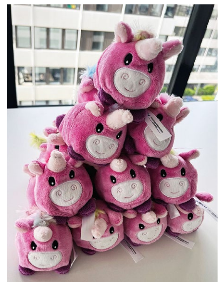
Auch ein neues Maskottchen durfte seitens der Kammer nicht fehlen.

Eine weitere Gruppe Schülerinnen machte im Labor für Bau- und Raumakustik Versuche dazu, wie Lärm gemessen werden kann. Die Mädchen untersuchten ihre mitgebrachten Kopfhörer mit einem Handschallpegelmessgerät.