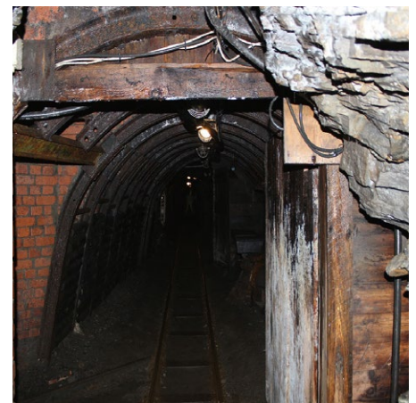
Eingang zu einem alten Bergstollen.

+ Das detaillierte Programm und das Anmeldeformular finden Sie unter: www.bayika.de