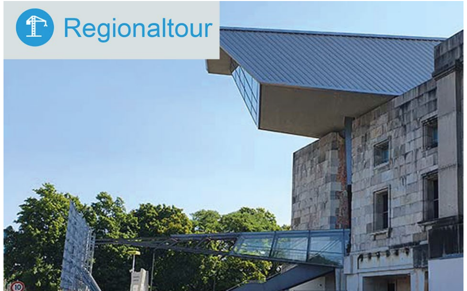
Seit 2020 wird das Dokumentationszentrum Reichsparteitagsgelände in Nürnberg ausgebaut.

Das Kostenvolumen der Gesamtbaumaßnahme beläuft sich auf gut 25,7 Millionen Euro. Von 1998 bis 2001 wurde der Nordflügel der unvollendeten Kongresshalle baulich in das Dokumentationszentrum eingepasst. Nun soll das Zentrum an das wachsende Aufgabenspektrum und den aktuellen technischen Standard musealer Bildungseinrichtungen angepasst werden. Ziel des Bauvorhabens ist ein generationenverbindendes, innovatives und in jeder Hinsicht inklusives Museumsangebot für den steigenden Besucherzustrom aus aller Welt.