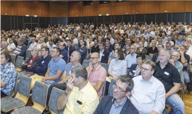
Die Stadthalle Friedberg war beim 35. Fortbildungsseminar Tragwerksplanung prall gefüllt.

tionen über alte Gebäude zu einer realitätsnäheren Bewertung bestehender Massivbauwerke führen. Neben einem historischen Überblick über normative Festlegungen (DIN 1045) zeigte er anschaulich, wie man die Betondruckfestigkeit umrechnen kann, was es dabei zu beachten gibt und wie eine statistische Auswertung in Bauwerken oder Bauwerksteilen funktioniert.