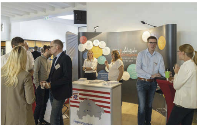
Als Kooperationspartner war das Regierungspräsidium Gießen zugleich auch als Aussteller mit einem großen Stand vertreten.